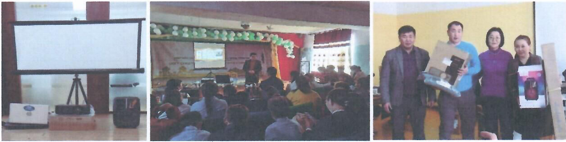
Зураг 7. ГИДЦГ-ын А хэсгийн Орчны бүсийн сумдын ЕБС, сургуулийн эко-клубын удирдагч багш нарт гардуулсан тоног төхөөрөмж

Үндэсний болон орон нутгийн удирдлага, нийгмийн хүрээний болон ашиг хүртэгчдийн түвшинд Мэдлэг, хандлага, дадлын судалгаа (КАР), Ногоон хөгжлийг хэрэгжүүлэх замаар экосистемийн үйлчилгээг сайжруулах чадавхын үнэлгээг төслөөс зохион байгууллаа. Мэдлэг, хандлага, дадлын судалгааны үр дүнгээс харахад төслийн хүрээнд зохион байгуулсан мэдлэг олгох сургалтын үзүүлэлтүүд 2019 онтой харьцуулахад 227% буюу 2.7 дахин өссөн байна. Үүнд, мэдлэгийн түвшин 6.6%-д хүрч 3,91%-иар, туршлагын түвшин 24.63%-д хүрч 3,91%-иар өссөн. Харин бэлчээр, ойн нөөц, ховор амьтан, ургамлыг хамгаалах иргэдийн хандлагад 2019 онтой харьцуулахад тооны хувьд томоохон өөрчлөлт гараагүй, хандлагын түвшин 73 хувьтай буюу 2019 онтой харьцуулахад 1 хувиар буурсан ч иргэд өөрсдийн зүгээс арга хэмжээ хэрэгжүүлэхтэй санал нэгтэй болж, байгалийн хүчин зүйл, бусад гаднын хүчин зүйл, мөн “миний мэдэх асуудал биш, би юу ч хийж мэдэхгүй” гэсэн сөрөг хандлагууд бүгд эергээр солигдсон сайн үр дүн гарсан байна. Суурь түвшинтэй харьцуулахад байгаль орчин болон Биологийн олон янз байдлын хамгааллын дадал зуршил 12,8%-иар өссөн байна.