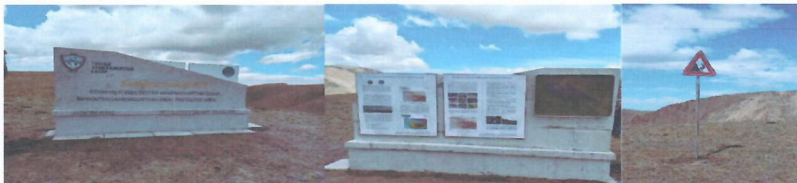
Зураг 2. Баянцагаан ОНТХГ-ын тэмдэг, тэмдэглэгээ

дэмжлэг үзүүлэх зорилтын хүрээнд цөлжүү хээрийн эмзэг экосистемийг төлөөлж буй Баянхонгор аймгийн Баянцагаан сумын “Баянцагааны нуруу”-ны Орон нутгийн тусгай хамгаалалттай газарт БОАЖЯ-наас батлан гаргасан зааварчилгааны дагуу тэмдэгжүүлэх ажлыг чанар, стандартын түвшинд гүйцэтгэн сумын ЗДТГ-т хүлээлгэн өглөө.