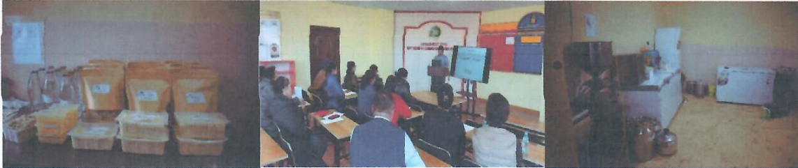
Зураг 5. Сүү, сүүн бүтээгдэхүүний үйлдвэрлэл

150 сая төгрөгийн хамтын санхүүжилтээр 2021 онд Завхан аймгийн Их-Уул суманд, 2022 онд Баянхонгор аймгийн Баян-өндөр сум, Архангай аймгийн Батцэнгэл суманд өдөрт 1 тонн сүү боловсруулах хүчин чадалтай үйлдвэр тус тус байгуулагдлаа. Үйлдвэр байгуулснаар нийт 12 шинэ ажлын байр бий болж, малчдын бүлгээс жилдээ 300 гаруй сая төгрөгийн сүү худалдан авч, малчдын өрхийн орлогыг нэмж, орон нутагт үйлдвэрийн аргаар боловсруулсан 7-8 төрлийн пробиотик бүтээгдэхүүн бий болж, тэдгээрийг сумын эмнэлэг, сургуулийн үдийн цай хөтөлбөр, иргэдийн хэрэгцээнд нийлүүлэх боломжтой болж байна.