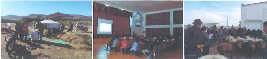
Зураг 3. Ногоон тэжээлийн ургамлаар дарш бэлтгэх сургалтын явц

Төслийн зорилтот 13 суманд байгуулагдсан 225 малчны бүлгүүдийн малын тэжээлийн хангамж, ашиг шимийг нэмэгдүүлэх замаар бэлчээрийн даац ачааллыг бууруулах, малчдын орлогыг нэмэгдүүлэх хүрээнд Баянхонгор аймгийн Баацагаан, Баянцагаан, Баян-Өндөр, Шинэжинст сумын малчдад орон нутагт малын тэжээлийн нөөц, чанар, хангамжийг сайжруулах зорилгоор орон нутагт олдоц, ихтэй тэжээлийн ургамлууд, түүхий эдийн найрлага, шимт чанар, түүгээр дарш бэлтгэх арга технологи, ач холбогдол, даршаар төрөл бүрийн малыг тэжээх норм, хэмжээ, арга, ажиллагааг зааж сургах практик сургалт зохион байгуулсан.