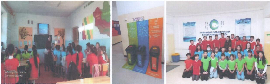
Зураг 6. “Эко клубийн сурагчдад экологийн боловсрол олгох сургалт

Бичил төсөл хэрэгжүүлж буй ТББ-ын нэг болох Говь-Алтай аймгийн Цогт сумын Баянтоорой тосгоны Мөнгөлөг тооройн төгөл ТББ-ын “Эко клубийн сурагчдад экологийн боловсрол олгох сургалт зохион байгуулах” төсөл нь 2022 онд Говь-Алтай аймгийн 5, Баянхонгор аймгийн 2 эко клубийн 218 сурагчид сургалт зохион байгуулж, хог хаягдал ангилан ялгах, дадал хэвшлийг бий болгох зорилгоор клубийн сурагчидтай хамтран хог хаягдал ангилан ялгах буланг тохижуулан 7 суманд хүлээлгэн өглөө. Мөн клубийн сурагчид сургалтаар олж авсан мэдлэгээ бататгах зорилгоор сумандаа хог хаягдлыг бууруулах, албан байгууллагуудыг цэцэгжүүлэх, иргэдийн эрүүл аюулгүй орчинд амьдрах зэрэг аянуудыг зохион байгуулж байна.