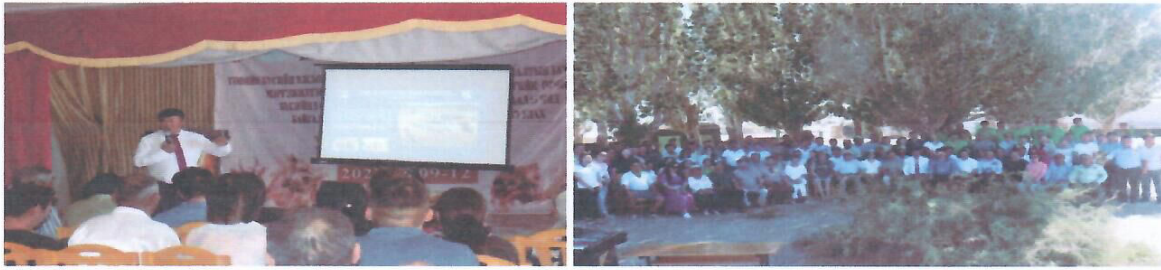
Зураг 3. Говийн бүсийн УТХГ-ын хамгаалалтын захиргаадын мэргэжилтэн байгаль хамгаалагч, ГИДЦГ-ын А хэсгийн орчны бүсийн 5 сумын БОХУ-ын байцаагч, байгаль хамгаалагч, байгаль хамгаалах нөхөрлөлүүдийн уулзалт, зөвлөгөөн

Төслийн зорилтот 13 суманд байгуулагдсан 225 малчны бүлгүүдийн малын тэжээлийн хангамж, ашиг шимийг нэмэгдүүлэх замаар бэлчээрийн даац ачааллыг бууруулах, малчдын орлогыг нэмэгдүүлэх хүрээнд Баянхонгор аймгийн Баацагаан, Баянцагаан, Баян-Өндөр, Шинэжинст сумын малчдад орон нутагт малын тэжээлийн нөөц, чанар, хангамжийг сайжруулах зорилгоор орон нутагт олдоц, ихтэй тэжээлийн ургамлууд, түүхий эдийн найрлага, шимт чанар, түүгээр дарш бэлтгэх арга технологи, ач холбогдол, даршаар төрөл бүрийн малыг тэжээх норм, хэмжээ, арга, ажиллагааг зааж сургах практик сургалт зохион байгуулсан.