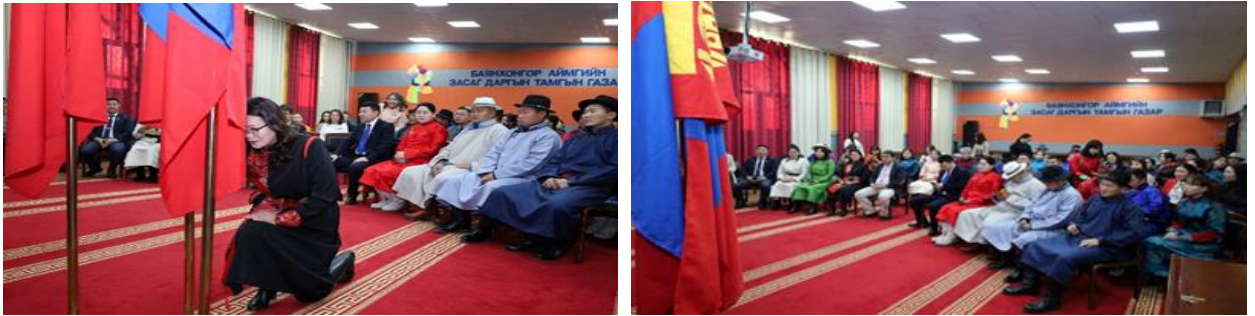
Зураг дээр: “Төрийн албан хаагчийн тангараг” өргүүлэх ёслолын ажиллагаа

захиргааны 15 байгууллага, 10 сумын нийт 70 албан хаагчаар “Төрийн албан хаагчийн тангараг” өргүүлэх ёслолын ажиллагааг зохион байгууллаа.