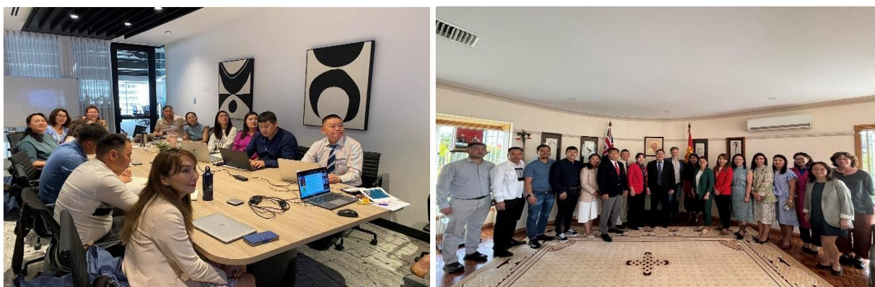
Зураг дээр: “Уур амьсгалын өөрчлөлтийн асуудлыг Монгол орны усны нөөцийн нэгдсэн менежментийн төлөвлөлтөд тусгах нь” сэдэвт манлайллын хөтөлбөрт хамрагдсан албан хаагчид

Австралийн Засгийн Газар, “Healthy Land and Water” олон улсын төрийн бус байгууллагаас “Уур амьсгалын өөрчлөлтийн асуудлыг Монгол орны усны нөөцийн нэгдсэн менежментийн төлөвлөлтөд тусгах нь” сэдэвт манлайллын хөтөлбөрт Байгаль орчин, аялал жуулчлалын газраас 2 албан хаагч хамрагдлаа.