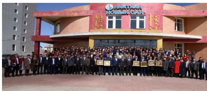
Зураг дээр: Шагнагдсан сум, байгууллагын албан хаагчид

Тэргүүн байранд “Чандмань-Баянхонгор” ХК, дэд байранд “Цэвэр хот” ОНӨААТҮГ, тусгай байранд Баянхонгор эрчим хүч ЦТХХК шалгарч, шагнагдсан байна.