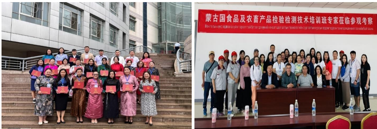
Зураг дээр: Сургалтад хамрагдсан албан хаагчид

Аймгийн Хүнс хөдөө аж ахуйн газрын мэргэжилтнүүдийг БНХАУ-ын Өвөр Монголын өөртөө засах оронд зохион байгуулагдсан "Монголын хүнс, хөдөө аж ахуйн гаралтай бүтээгдэхүүний хяналт шалгалтын технологи" сэдэвт 21 хоногийн чадавхжуулах сургалт, БНСУ-д "Хүнсний аюулгүй байдал болон загас үржүүлгийн технологи" сэдэвт 7 хоногийн чадавхжуулах сургалтад хамруулав.