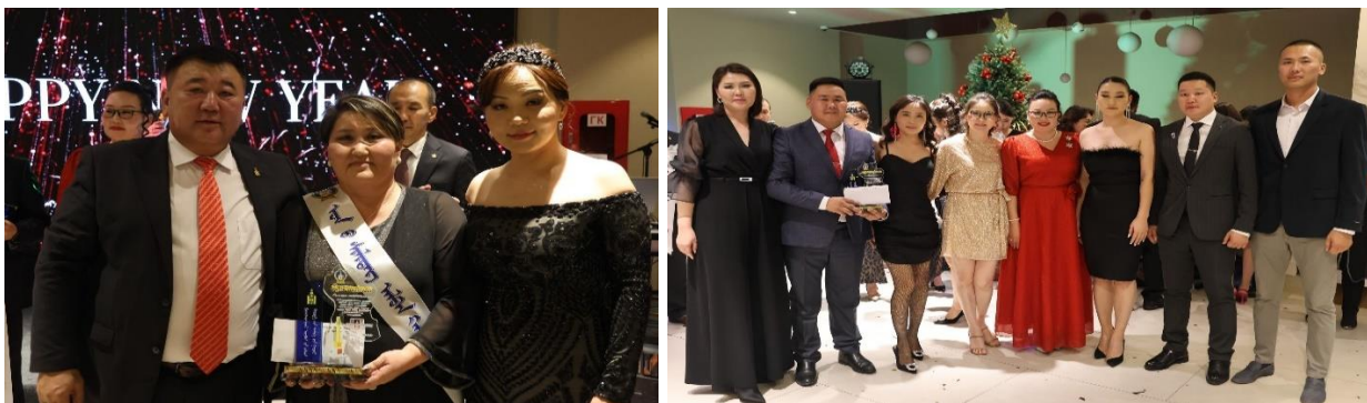
Зураг дээр: 2023 оны шилдэг албан хаагчид

Байгууллагын 2023 онд хийж гүйцэтгэсэн ажил, үр дүнгийн үнэлгээгээр манлайлан ажилласан Хөгжлийн бодлого төлөвлөлт, хөрөнгө оруулалтын хэлтэс мөн 15 албан хаагчийг шагнаж урамшуулав.