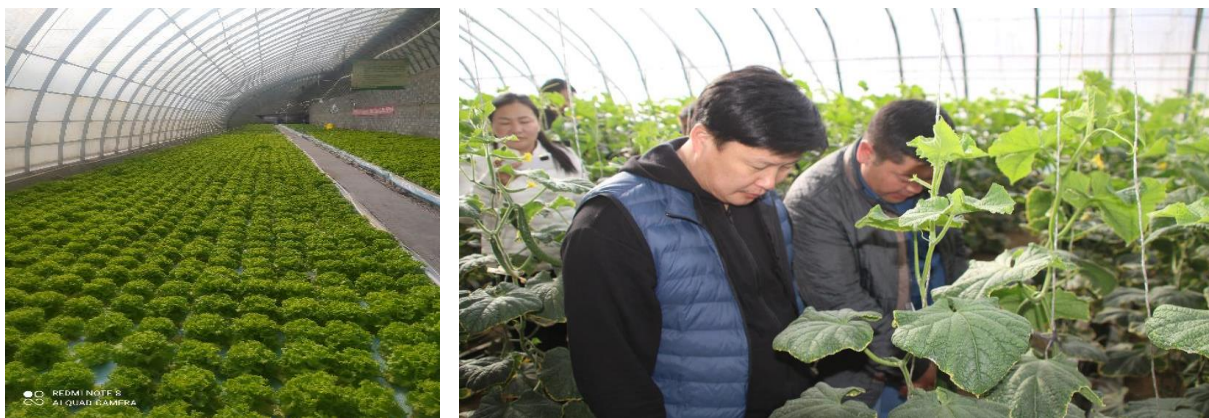
Зураг дээр: БНХАУ-ын Ганьсү мужийн Жючуан хотод туршлага судалж байна.