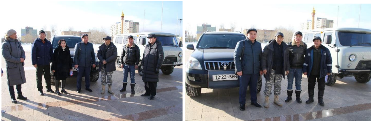
Зураг дээр: Автомашин гардуулах үйл ажиллагаа

Мэргэжлийн хяналтын байгууллага татан буугдсан тул байгууллагаас үйл ажиллагаандаа ашиглаж байсан, ашиглахаар төлөвлөсөн байсан автомашинуудыг аймаг орон нутагт хүлээлгэн өгч, хүн ардын эрүүл мэндийн тусламж үйлчилгээнд нэн шаардлагатай сумдад хүлээлгэн өглөө.