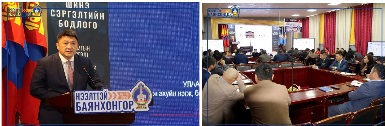
Зураг дээр: Нээлттэй Баянхонгор сургалт, зөвлөгөөн

сурталчлах, тэдгээрт үзүүлэх дэмжлэгийн талаар багтаасан “НЭЭЛТТЭЙ БАЯНХОНГОР” хөтөлбөрийг аймгийн Засаг дарга Д.Мөнхсайхан танилцуулав.