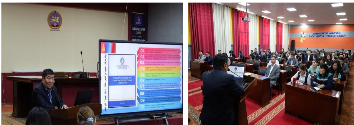
Зураг дээр: “Төрийн бүтээмж ба үнэлгээ, мониторинг” сургалт

Баянхонгор аймгийн бодлогын баримт бичиг хууль тогтоомж, тогтоол шийдвэрийн хэрэгжилт, байгууллагын үйл ажиллагааны үр дүнг нэмэгдүүлэх, сайн туршлагыг түгээн дэлгэрүүлэх, байгууллага хоорондын уялдаа холбоог сайжруулах зорилгоор АЗДТГ-ын Хяналт шинжилгээ, үнэлгээний хэлтсээс аймгийн Засаг даргын эрхлэх асуудлын хүрээний 23 агентлаг, Төрийн болон орон нутгийн өмчит 10 байгууллагын удирдлага, хууль тогтоомж, тогтоол шийдвэрийн хэрэгжилт хариуцсан мэргэжилтний дунд зохион байгуулсан.