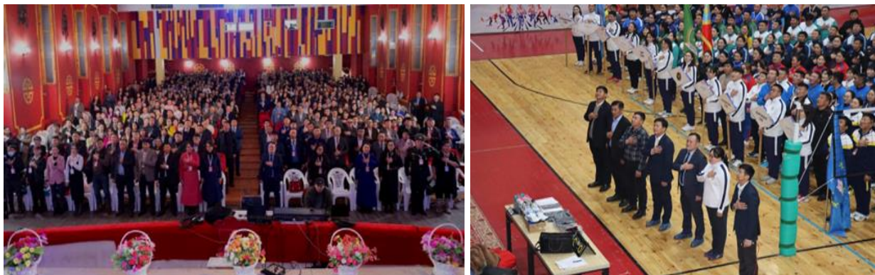
Зураг дээр: “Төрийн албаны ёс зүй, хандлага соёлын шинэтгэл” сэдэвт сургалт, зөвлөгөөн, спортын бага наадам

“Төрийн албаны ёс зүй, хандлага соёлын шинэтгэл” сэдэвт сургалт, зөвлөгөөн, спортын бага наадмыг аймгийн Засаг даргын тамгын газар, 20 сумын Засаг даргын Тамгын газрын 500 орчим төрийн албан хаагчдыг хамруулан 2 өдрийн турш зохион байгуулж, аймгийн Засаг даргын нөөц хөрөнгөөс 25.5 сая төгрөгийг зарцууллаа.