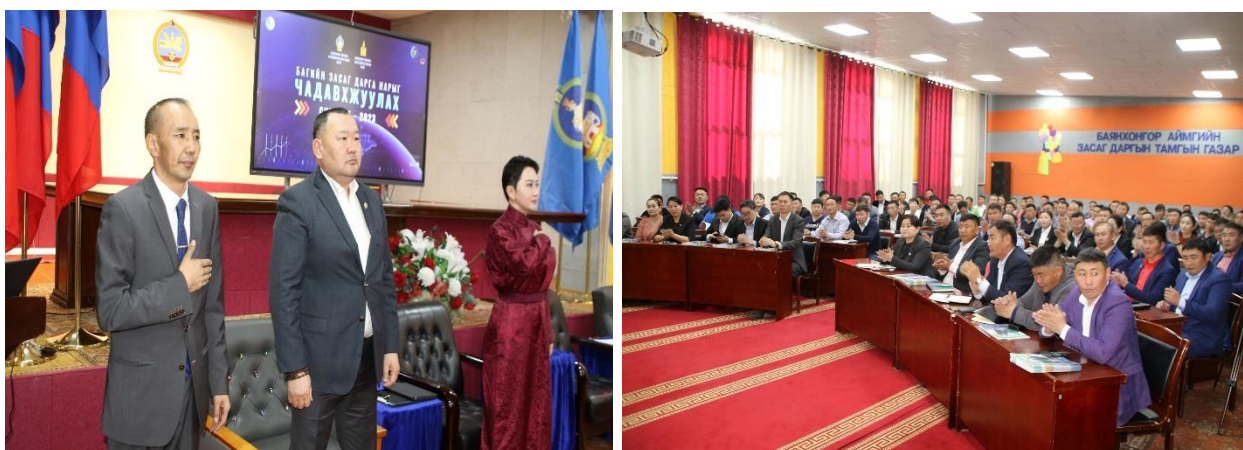
Зураг дээр: 20 сумын засаг даргын орлогч, 105 багийн дарга нарын дунд сургалт семинар

Засаг захиргааны анхан шатны нэгж болох багийн Засаг дарга нарт Монгол Улсын хууль, тогтоомж, тогтоол шийдвэрийг танилцуулах, багийн иргэдэд чиглэсэн төрийн үйлчилгээг чанаржуулж, харилцан хамтран ажиллах агуулгын хүрээнд аймгийн ЗДТГ-аас 20 сумын Засаг даргын орлогч, 105 багийн дарга нарын дунд нэгдсэн сургалт, семинарыг зохион байгуулав. Сумдын орлогч дарга болон багийн дарга нар Монгол Улсын урт хугацааны бодлого шийдвэр, хууль тогтоомжийн хэрэгжилт, гэмт хэргийн нөхцөл байдал, нийгмийн салбарын анхаарах асуудал, иргэний болон хөрөнгийн бүртгэл, гэр бүл, хүүхэд залуусын талаар төрөөс авч хэрэгжүүлж буй арга хэмжээ, ХАА, мал эмнэлгийн чиглэлээр анхаарах асуудал, архив, албан хэрэг хөтлөлт, гамшиг ослоос урьдчилан сэргийлэх, цэргийн бүртгэл, статистик-ын талаар цогц мэдээллээр хангагдаж, өөрийн хариуцсан баг хорооныхоо үйл ажиллагаандаа тусган хэрэгжүүлэх болно.