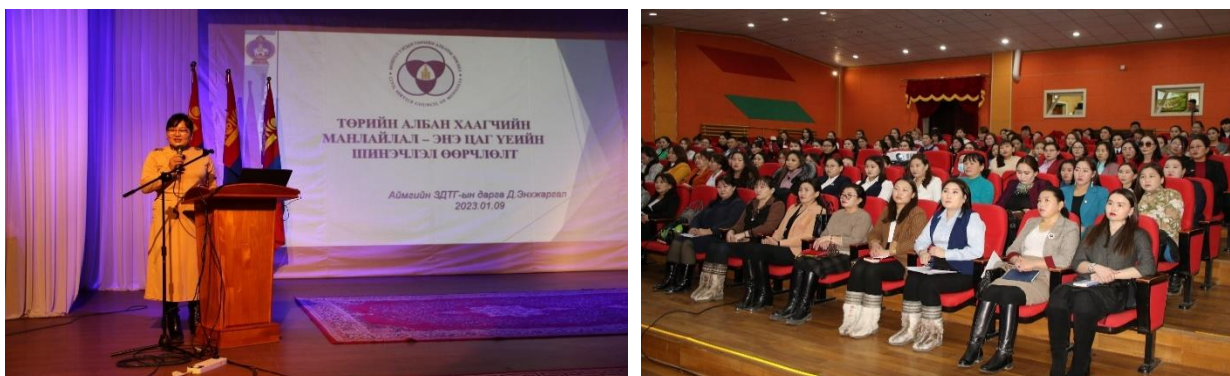
Зураг дээр: “Төрийн архив, албан хэрэг хөтлөлтийн шинэчлэлт - өөрчлөлт” нэгдсэн зөвлөгөөн

Төрийн Архив, албан хэрэг хөтлөлтийн эрх зүйн шинэчлэлтийг танилцуулах, сурталчлах, шинэчлэл өөрчлөлтийг нэтрүүлж, ажлын хариуцлага, ёс зүй, ур чадварыг дээшлүүлэх зорилгоор Баянхонгор аймгийн ЗДТГ-аас Төрийн архивын тасагтай хамтран “Төрийн архив, албан хэрэг хөтлөлтийн шинэчлэлт - өөрчлөлт” нэгдсэн зөвлөгөөнийг Баянхонгор аймгийн 200 гаруй төрийн байгууллагын архив, албан хэргийн ажилтнуудыг оролцуулан зохион байгуулав.