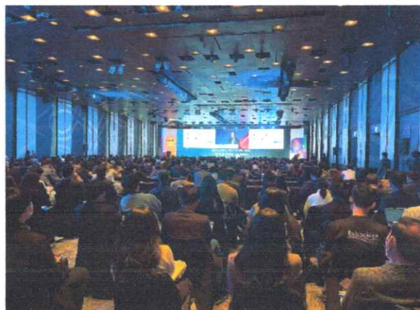
Зураг дээр: БНСУ-ын Сөүл хотод 2022.10.28-2022.11.04-ний өдрийн хугацаанд зохион байгуулагдсан олон улсын хүний нөөцийн форум