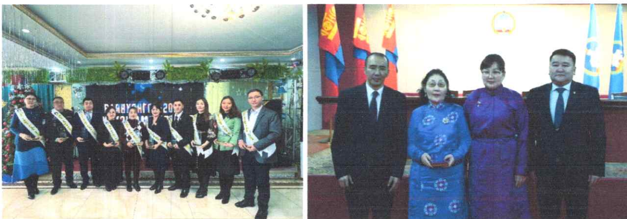
Зураг дээр: 2022 оны шилдэг албан хаагчид

Аймгийн хэмжээнд төрийн албан хаагчдын ажиллах нөхцөл нийгмийн баталгааг хангах чиглэлээр 2.071.7 сая төгрөгийн санхүүжилтийн асуудлыг шийдвэрлэж, 1 сумын Засаг даргын тамгын газрын барилга, 3 байгууллагын компьютер, тоног төхөөрөмж, 20 сумын 40 багт мотоцикл, 3 сумд авто машин, 3 байгууллагад авто машин, Нэгдсэн эмнэлгийн Яаралтай тусламжийн тасагт 160 сая төгрөгийн өртөг бүхий LH8800 загварын амьсгалын аппаратыг шийдвэрлэсэн байна.