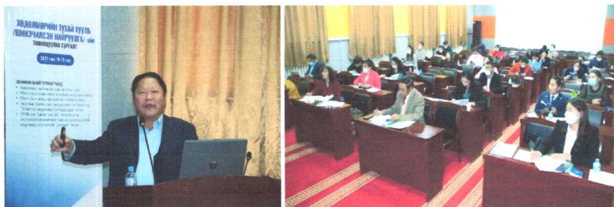
Зураг дээр: "Хөдөлмөрийн тухай хуулийн шинэчилсэн найруулгыг танилцуулах сургалт

Хөдөлмөрийн тухай хуулийн шинэчилсэн найруулгыг танилцуулах сургалтыг ХНХЯ,-аас Баянхонгор аймагт зохион байгууллаа. Сургалтад орон нутгийн төрийн болон ТББ, ажил олгогчдын төлөөлөл 30 гаруй холбогдох удирдлага, албан хаагчид оролцов.