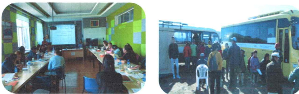
Зураг дээр: Албан хаагчдыг сургалт, үзлэг, оношилгоонд хамруулж байна.

Монгол Улсын Ерөнхийлөгчийн Тамгын газар, аймгийн ИТХ, Засаг даргын тамгын газар холбогдох байгууллагууд хамтран тус аймагт “Эрүүл Монгол хүн” арга хэмжээг зохион байгуулж 360 эмч, эмнэлгийн мэргэжилтэн, төрийн албан хаагчийг хамруулсан.