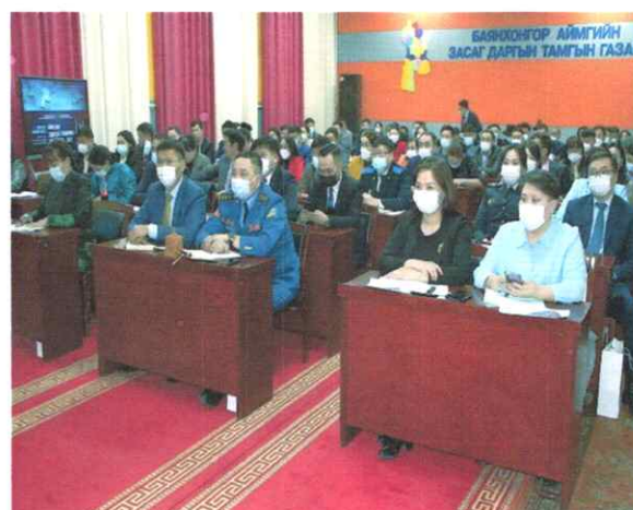
Зураг дээр: “Төрийн байгууллагуудын удирдах ажилтны сургалт, зөвлөгөөн” - 2022 он