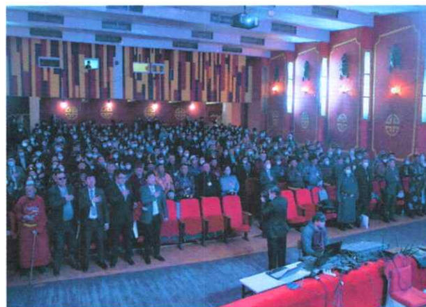
Зураг дээр: Аймгийн “Хөгжлийн зөвлөгөөн”-2022 он