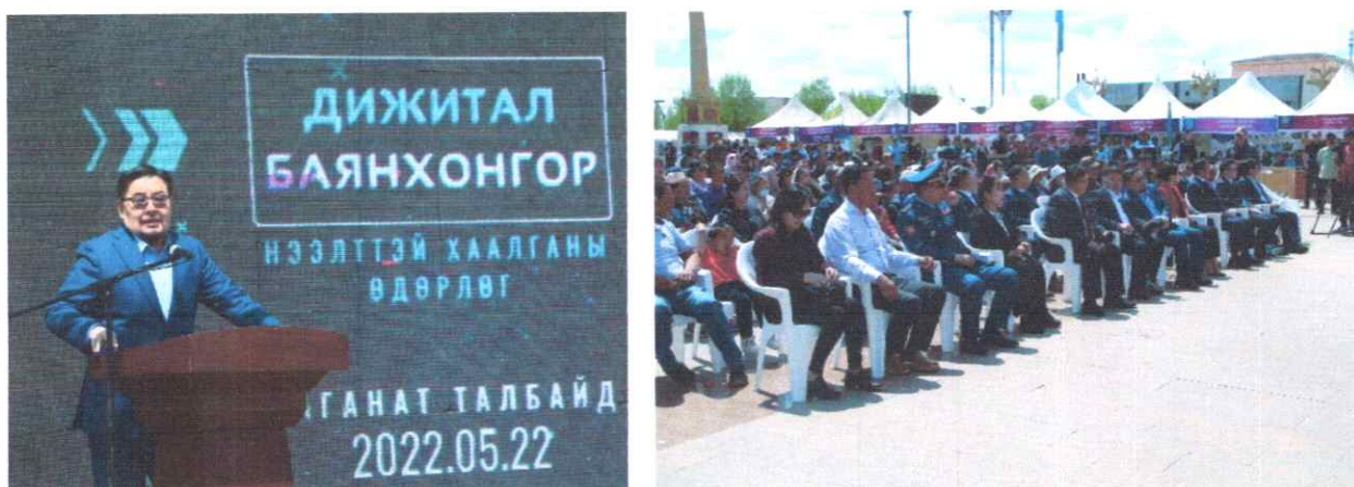
Зураг дээр: "Дижитал Баянхонгор" арга хэмжээ

Баянхонгор аймгийн Иргэдийн төлөөлөгчдийн хурал, Засаг даргын тамгын газар, Цахим хөгжил, харилцаа холбооны яам, E-Mongolia академи, "Эмпасофт" ХХК, ICT Group хамтран "Дижитал Баянхонгор" арга хэмжээг 3 өдөр нийт 187 байгууллагын 598 албан хаагчийг хамруулж, төрийн байгууллагын удирдлага, IT инженер, мэдээллийн технологийн ажилтнууд "Цахим үндэстэн –Дижитал аймаг", "Тогтвортой хөгжил- технологийн шийдэл, ач холбогдол", "Дижитал орчинд ажиллах, чадварлаг хүмүүсийг бэлтгэх сургах боломжууд" сэдвээр сургалтуудыг зохион байгуулав.