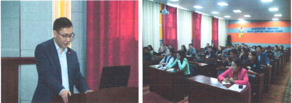
Зураг дээр: Бодлогын баримт бичиг, хууль тогтоомжийн тайлагналтыг чанаржуулах, албан хаагчдыг чадваржуулах сургалт

хууль тогтоомжийн тайлагналтыг чанаржуулах, албан хаагчдыг чадваржуулах сургалтыг 2 өдөр зохион байгуулав. Сургалт бодлогын хэлтсүүдийн харьяа агентлагуудын дарга эрхлэгч, тайлан мэдээ хариуцдаг хяналт шинжилгээ үнэлгээний мэргэжилтнүүдийг танхимаар болон цахимаар хамруулж нийт 100 гаруй албан хаагчийг хамруулав.