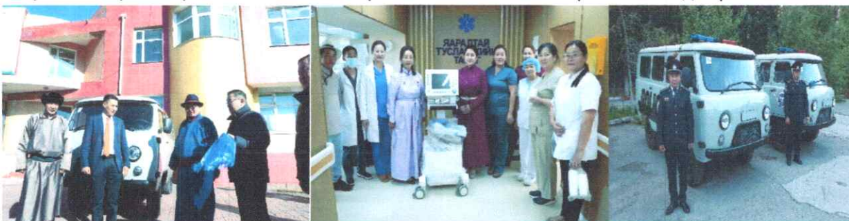
Зураг дээр: Авто машин болон тоног, төхөөрөмжийг гардуулж байна.

Аймгийн хэмжээнд төрийн албан хаагчдын ажиллах нөхцөл нийгмийн баталгааг хангах чиглэлээр 2.071.7 сая төгрөгийн санхүүжилтийн асуудлыг шийдвэрлэж, 1 сумын Засаг даргын тамгын газрын барилга, 3 байгууллагын компьютер, тоног төхөөрөмж, 20 сумын 40 багт мотоцикл, 3 сумд авто машин, 3 байгууллагад авто машин, Нэгдсэн эмнэлгийн Яаралтай тусламжийн тасагт 160 сая төгрөгийн өртөг бүхий LH8800 загварын амьсгалын аппаратыг шийдвэрлэсэн байна.