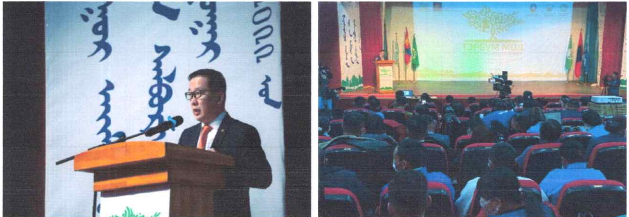
Зураг дээр: Монгол Улсын Ерөнхийлөгчийн санаачилсан “Тэрбум мод” үндэсний хөдөлгөөний хүрээнд “Баянхонгор аймгийн Ойн салбарын анхдугаар чуулган”-2022 он

Төрийн албан хаагчдын мэдлэг, мэргэжлийг дээшлүүлэх чиглэлээр хийгдсэн чухал бөгөөд өргөн хүрээтэй зохион байгуулагдсан ажил бол Төрийн албаны зөвлөлийн дарга Б.Баатарзориг ахлуулсан ажлын баг Баянхонгор аймагт ажиллаж, төрийн албан хаагчидтай уулзаж, үр дүнд суурилсан цалин хөлсний тогтолцоо, төрийн албан хаагчийн нийгмийн баталгаа, орон нутаг дахь төрийн албаны хүний нөөцийн хүрэлцээ, хангамж, шинэ сэргэлтийн бодлогын хэрэгжилт, төрийн бүтээмж зэрэг төрийн албаны шинэтгэлийн тухайлсан сэдвүүдээр мэдээлэл өгч, зөвлөлдөх уулзалт хэлэлцүүлгийг өрнүүллээ.