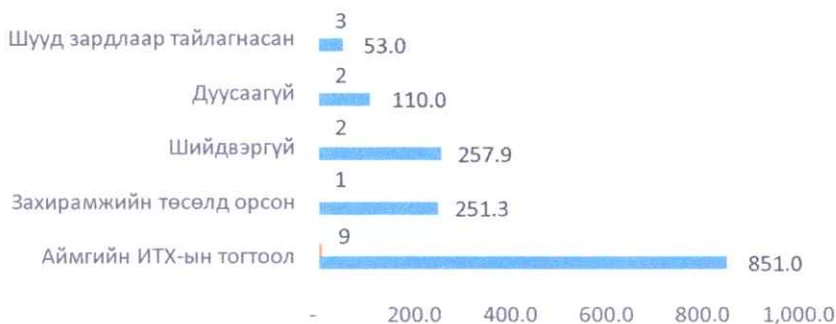
Их засварын зардлаар хийгдсэн хөрөнгө оруулалтын ажлыг хөрөнгөд бүртгэсэн байдал (сая төгрөг)