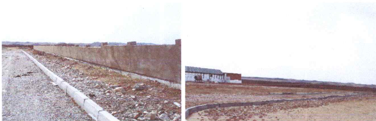
Хашаа нэлэнхийдээ хазайсан