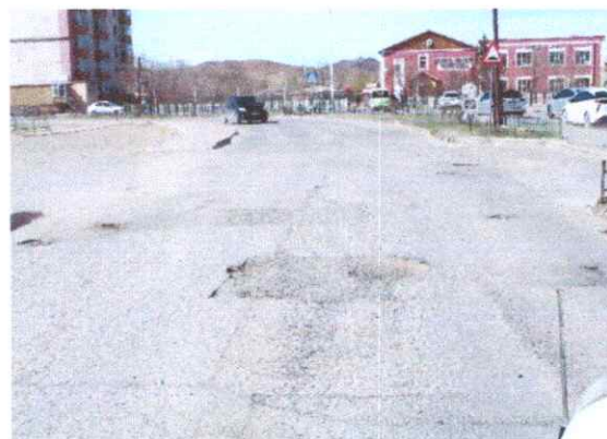
Цагдаагийн газраас арван мянгатын гэрлэн дохио хүртэлх зам