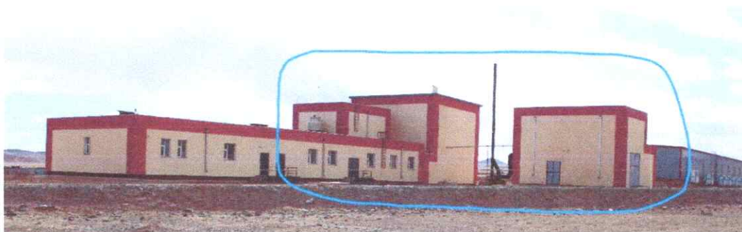
Ингэний сүүний үйлдвэрийн өргөтгөлийн барилгын хэсэг

Ингэний сүүний үйлдвэрийн барилга нь үйлдвэрийн тоног төхөөрөмж суурилуулах явцад барилгад өргөтгөл хийх шаардлага үүсэж зохиогчийн зөвшөөрлөөр өргөтгөл нэмж барьсан байна. Гэвч тухайн өргөтгөлийн барилга нь гүйцэтгэгч өөрийн хөрөнгөөр хийсэн гэх боловч төр хувийн хэвшлийн хооронд байгуулсан гэрээ, баримт бичиг байхгүй, төсөв магадлалаар орж байгаа талаар тайлбар өгсөн боловч ямар нэгэн нотлох баримт байхгүй байна.